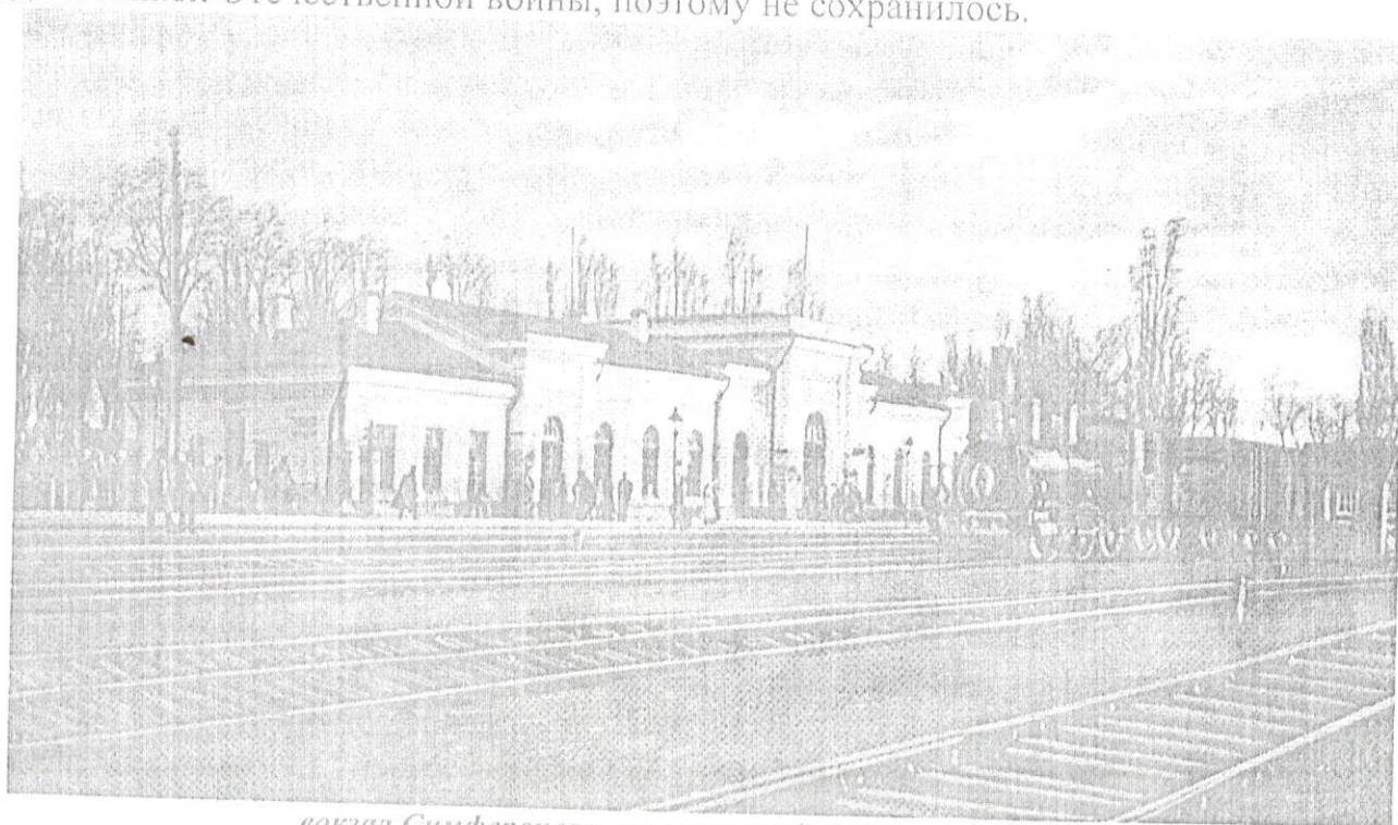
вокзал Симферополя, построенный на деньги Губонина

Первый железнодорожный вокзал Симферополя построен на деньги Петра Губонина, это его дар Симферополю. За свои заслуги он получил от городской думы звание «почетный житель Симферополя». Здание вокзала было сильно повреждено в годы Великой Отечественной войны, поэтому не сохранилось.